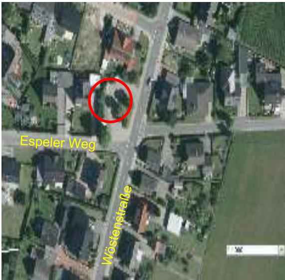
Bushaltestelle im Priestertum (Kreuzung Espeler Weg / Wöstenstraße)